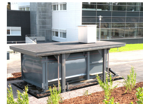
HABA MEGA Helsingissä

HABA MEGA on saanut useita kansainvälisen tason innovaatiopalkintoja ja referenssejä löytyy useista suurkaupungeista, kuten Moskovasta, Pekingistä, Dubaista, Tukholmasta ja Helsingistä.