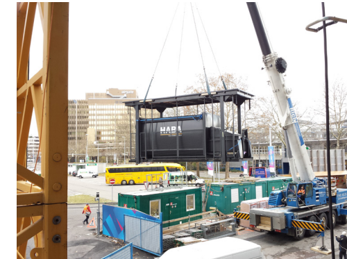
HABA MEGA järjestelmän asennus valmiiseen kaivantoon kestää vain 3-4 tuntia.